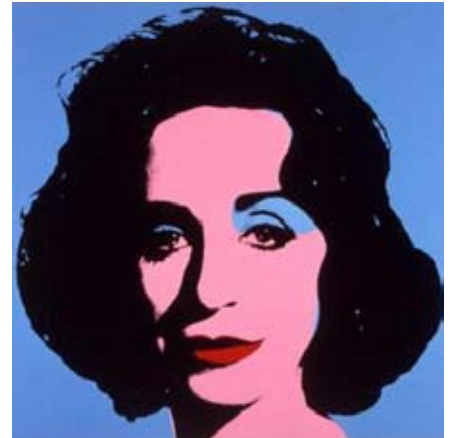
Deborah Kass, Blue Deb (2000)